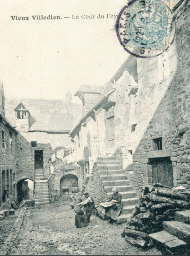
Vieux Villedieu. — La Cour du Foyer